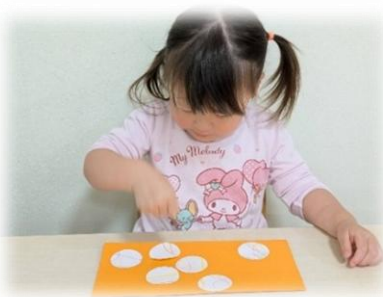
こっちにしようかなあ♪